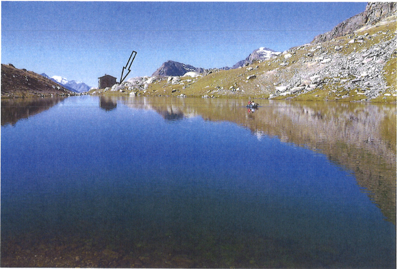
Annexe 2 : Photographie du type de station météorologique implantée