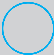
Chef de secteur