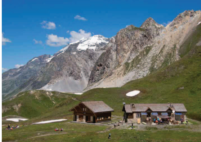
Le refuge du col du Palet (commune de Peisey-Nanxion). Un site qui domine à voir, en arrière-plan et de gauche à droite, le dôme de la Saché, les Roches rouges et la pointe du Chardonnet.