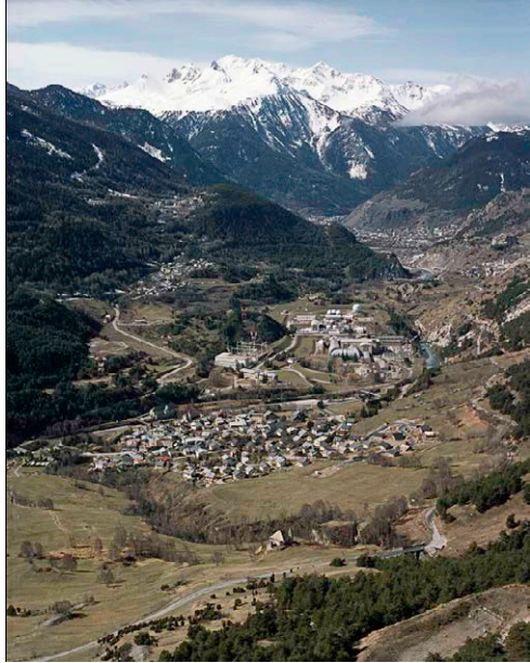
oppv-016-00 - 2006