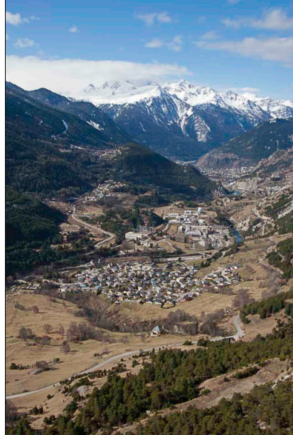
oppv-016-07 - 2015