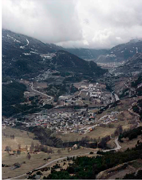
oppv-016-01 - 2008