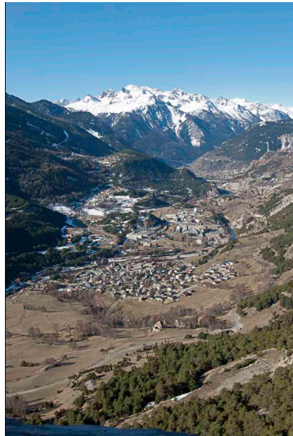
oppv-016-04 - 2012