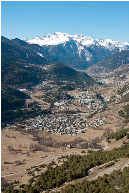
oppv-016-03 - 2011