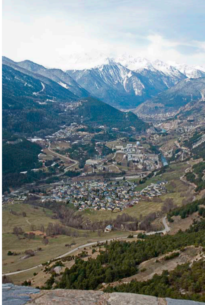
oppv-016-06 - 2014