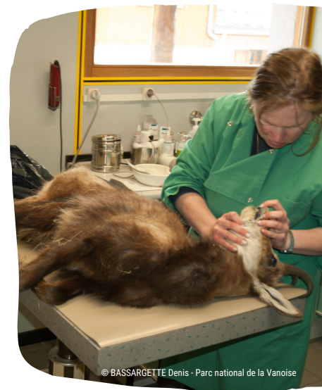
Examen d'un jeune chamois trouvé mort

Effets indirects : Via son influence sur la disponibilité et la qualité des ressources (cf. Fiche Bouquetin des Alpes), le changement climatique peut aussi affecter la condition physique des hôtes et leurs réponses immunitaires. Des individus dont la condition physique est altérée seront plus sensibles aux maladies et porteront des charges parasitaires plus importantes (Jolles et al., 2015).