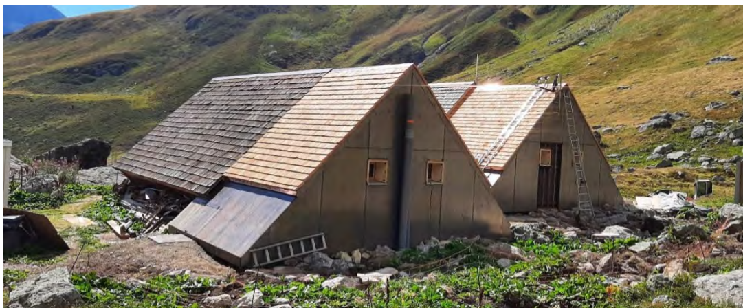
Création des 2 extensions à l'arrière des chalets existants

D'un coût total de 556 537 € HT, le projet a bénéficié d'un financement France Relance (327 055 €), du Département de la Savoie (76 635 €) en plus de l'autofinancement du Parc national de la Vanoise à hauteur de 152 847 €