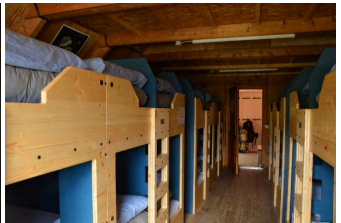
Aménagements intérieurs : sanitaires et dortoirs