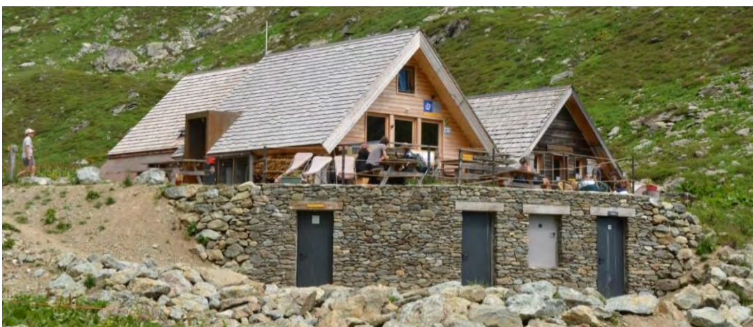
Création de la réserve et de 2 sanitaires en intégration semi-enterrée