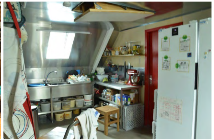
Aménagements intérieurs : salle à manger et cuisine